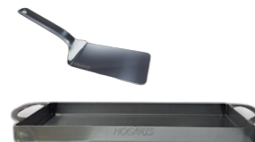
Plancha Bifera + Espatula hamburguesera