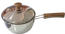
Cacerola N 18