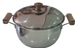
Cacerola N 22