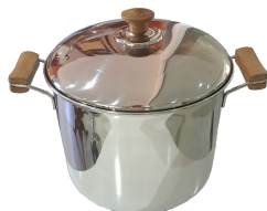
Olla N 24