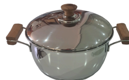
Cacerola N 24